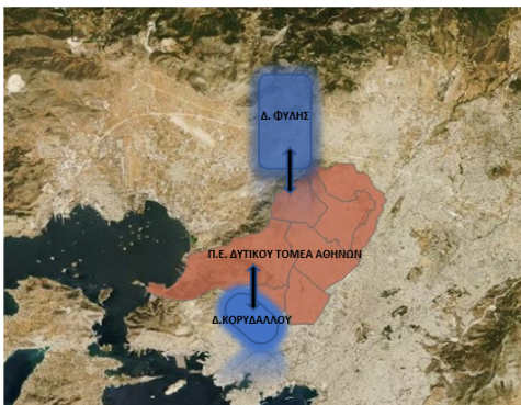
ΕΓΓΕΓΡΑΜΜΕΝΗ ΑΝΕΡΓΙΑ ΣΤΗΝ Π.Ε. ΔΥΤΙΚΟΥ ΤΟΜΕΑ ΑΘΗΝΩΝ, ΔΕΚΕΜΒΡΙΟΣ 2017

Η Δυτική Αθήνα εμφανίζει σημαντικά και διαχρονικά προβλήματα κοινωνικών διακρίσεων, μακροχρόνιας ανεργίας και φτώχειας. Μία συνοπτική εικόνα της περιοχής καταγράφεται από τον Εθνικό Μηχανισμό ΔΑΑΕ (ΕΙΕΑΔ), ως εξής: